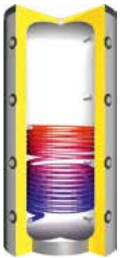
HAPSR 500 - 1.000 Pufferspeicher aus Stahl S235 mit 1 Wärmetauscher, Betriebsdruck 3 bar, max. Betriebstemperatur 95°