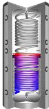
HAEHS 550 - 900 Hygiene-Schichtenkombispeicher aus Stahl S235JR, mit 1 Wärmetauscher